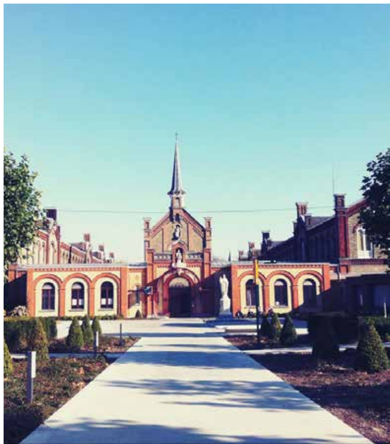
Museum Dr. Guislain is een cultureel ijkpunt voor de geschiedenis van en actuele discussies over psychiatrie en geestelijke gezondheid, zorg, kunst en waanzin. Het is gevestigd in het voormalige Guislaingesticht in Gent.