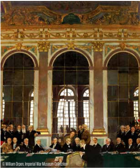
© William Orpen, Imperial War Museum Collection

Het Verdrag van Versailles werd op 28 juni 1919 ondertekend door Duitsland en de Entente. Het betekende het formele einde van de Eerste Wereldoorlog.